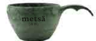
METSÄ KUKSA Ekologiset kuksat kestävät sekä kiehuvaan vettä että -30°C pakkasta. Kuksan voi pestä käsin luonossa tai astianpesukoneessa kotiin palatessa. Tuotteen tilavuus 2,1dl. Materiaali 50% mäntysellekuitu, 50% kestonuovi