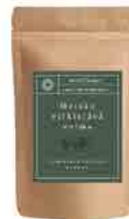
METSÄN VIRKISTÄVÄ VOIMA- AAMUTEE 20 G Vadelmanlehti, viherminttu, nokkonen, sitruunamelissa, kehäkukka