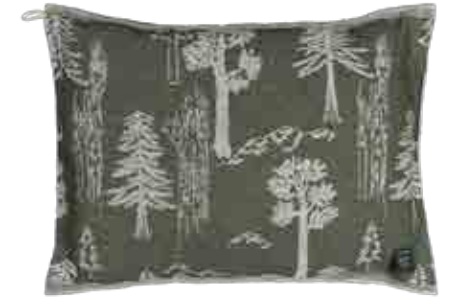
BOLETUS suuri saunatyyny, 60 x 42 cm 50% pellava, 50% puuvilla