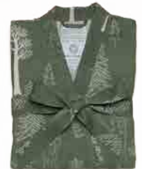
PELLAVAINEN KIMONO 100 % pellava. Koot: S/M ja L/XL