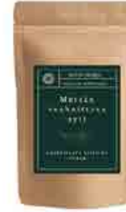
METSÄN RAUHOITAVA SYLI- ILTATEE 20 G Maitohorsman lehti, vadelmanlehti, maitohorsman kukka, piparminttu, sitruunamelissa, kanerva