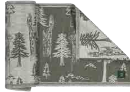
NEBULARIS laudeliina, 160 x 45 cm 50% pellava, 50% puuvilla