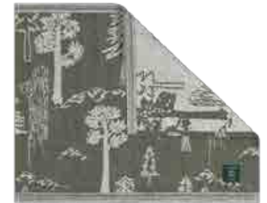
PADULOSA laudeliina, 55 x 45 cm 50% pellava, 50% puuvilla