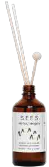
IKIMETSÄ HUONETUOKSU 100 ml

Luonnon puhtaista raaka-aineista valmistettu 100 % eteerinen öljy.