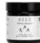
IKIMETSÄ METSÄMIKROBI-NAAMIO 60 ml

Luonnon puhtaista raaka-aineista valmistettu 100 % eteerinen öljy.