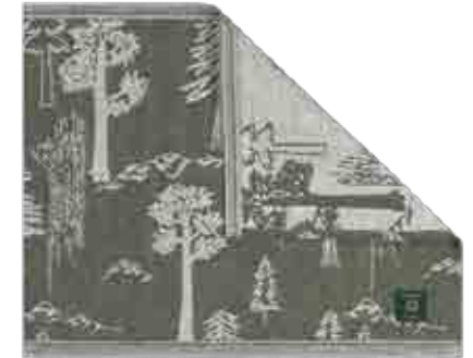
KEITTIÖPYYHE 50% pellava, 50% puuvilla Tuotteen koko: 55 x 45 cm