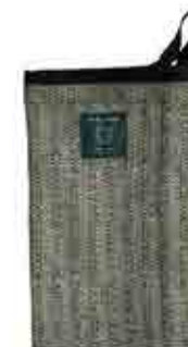
PESUKINNAS 15 x 20cm