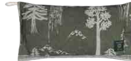
BADIA saunatyyny, 44 x 33cm 50% pellava, 50% puuvilla