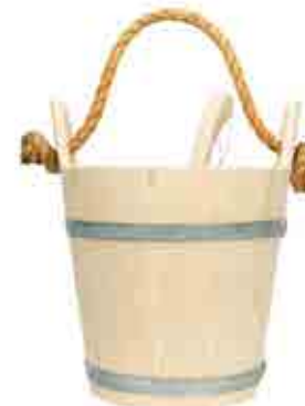
KIULU & KAUHA Saunakiulu 9L, suomalainen mänty Saunakauha 2,2 dl, suomalainen koivu