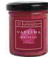
VADELMA- INKIVÄÄRIHUNAJA 120G