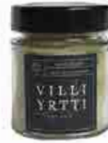
VILLIYRTTISUOLA 150 G Nokkonen, vadelmanlehti, mustaherukanlehti, merisuola