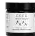
IKIMETSÄ METSÄMIKROBI-SHEAVOI 60 ml

Metsämikrobeita sisältävä kasvonaamio, jossa tehoaineina valkosavi ja hunaja.