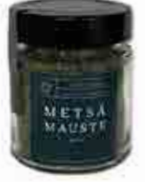
METSÄMAUSTE MIX 20 G Nokkonen, timjami, kuusenkerkkä, mustaherukan lehti, sitruunamelissa