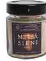
METSÄSIENISUOLA 150 G Herkkutatti, suppilovahvero, merisuola