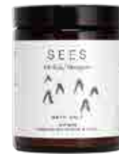
IKIMETSÄ KYLPYSUOLA 160 g

Ikimetsä-tuotesarja on saanut inspiraationsa suomalaisen metsän puhtaista raaka-aineista ja voimaannuttavasta vaikutuksesta. Tuotteet edistävät kehon ja mielen kokonaisvaltaista hyvinvointia luontoyhteyden kautta. SEES Companyn ja Metsä/Skogenin yhteistyö on luonteva liitto, sillä molemmat yrityksen jakavat vastuullisen arvopohjan ja kunnioituksen suomalaisiin ikimetsiin. Tuotteet valmistetaan Suomessa suomalaista työtä ja designia kunnioittaen.