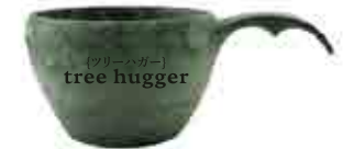
TREE HUGGER KUKSA Ekologiset kuksat kestävät sekä kiehuvaan vettä että -30°C pakkasta. Kuksan voi pestä käsin luonossa tai astianpesukoneessa kotiin palatessa. Tuotteen tilavuus 2,1dl. Materiaali 50% mäntysellekuitu, 50% kestonuovi